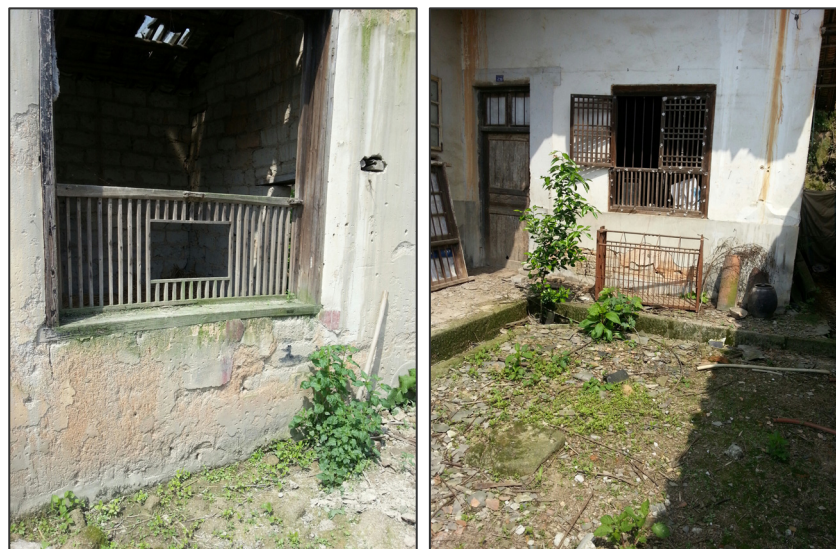
上图：是今日的祖屋已成废墟