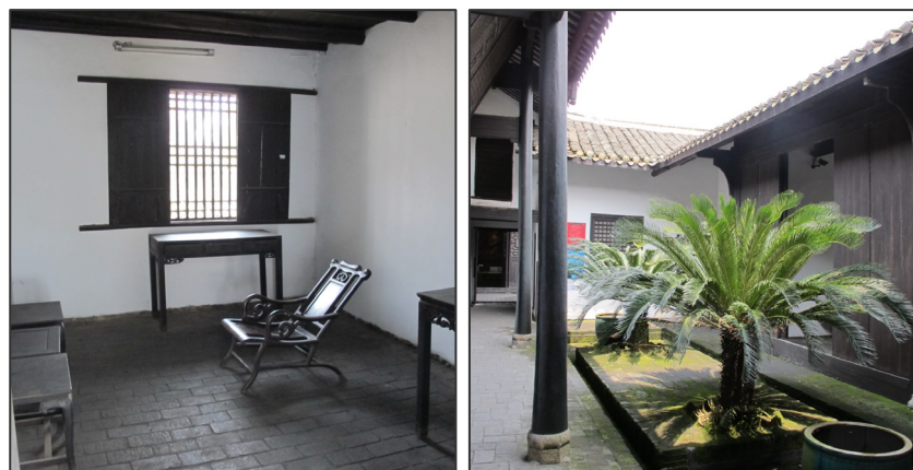
上图：是昔日的祖屋